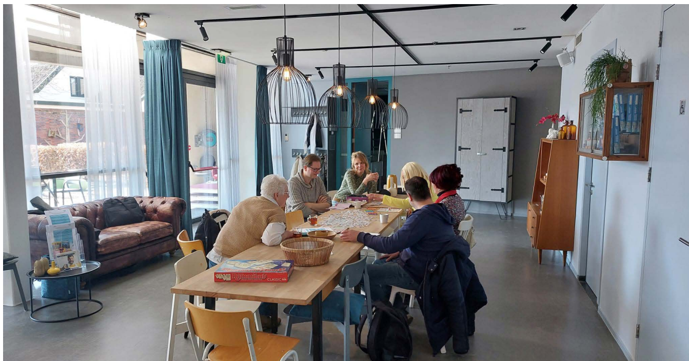
Elke dinsdag- en donderdagmiddag kunnen bezoekers een spelletje spelen of andere (herstel)activiteiten doen.

Via deze QR-code vind je het filmpje op YouTube dat stichting Out of the Box TV voor Vriendendiensten maakte. Of kijk op www.vriendendienstendeventer.nl/nieuws .